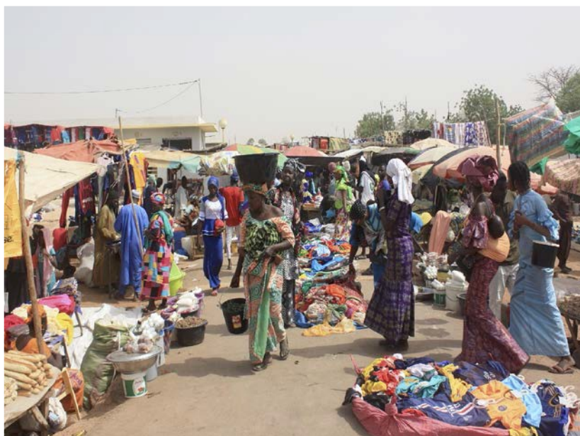
La frontière gambienne Washington Post