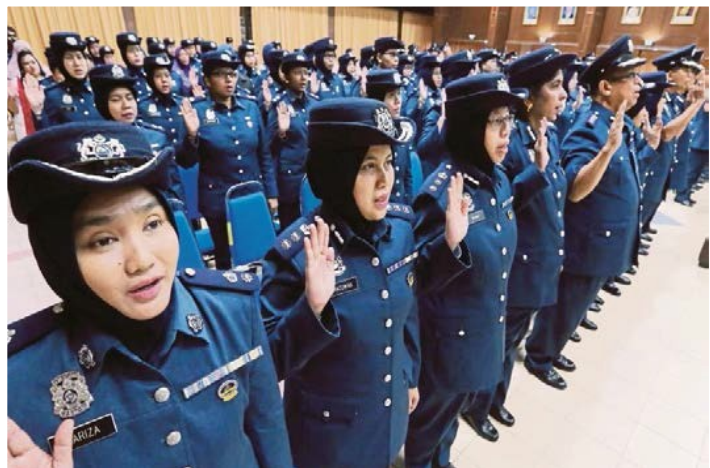
Le service des douanes malaisien s’engage à lutter contre la corruption (2017).