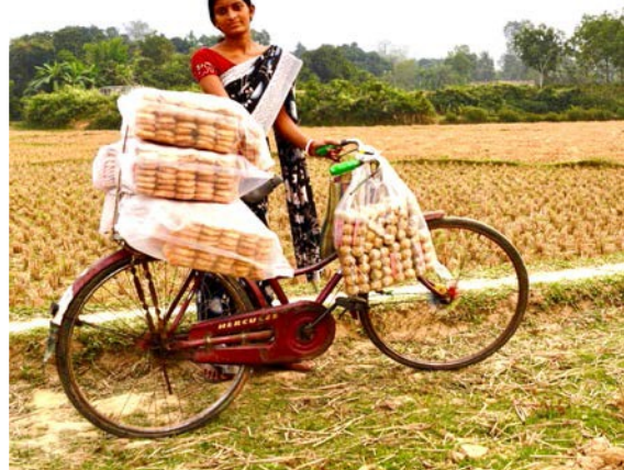
De Srinagar (Inde) à Chhagalnaiya (Bangladesh) CUTS INTERNATIONAL